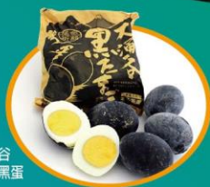
大涌谷溫泉小黑蛋