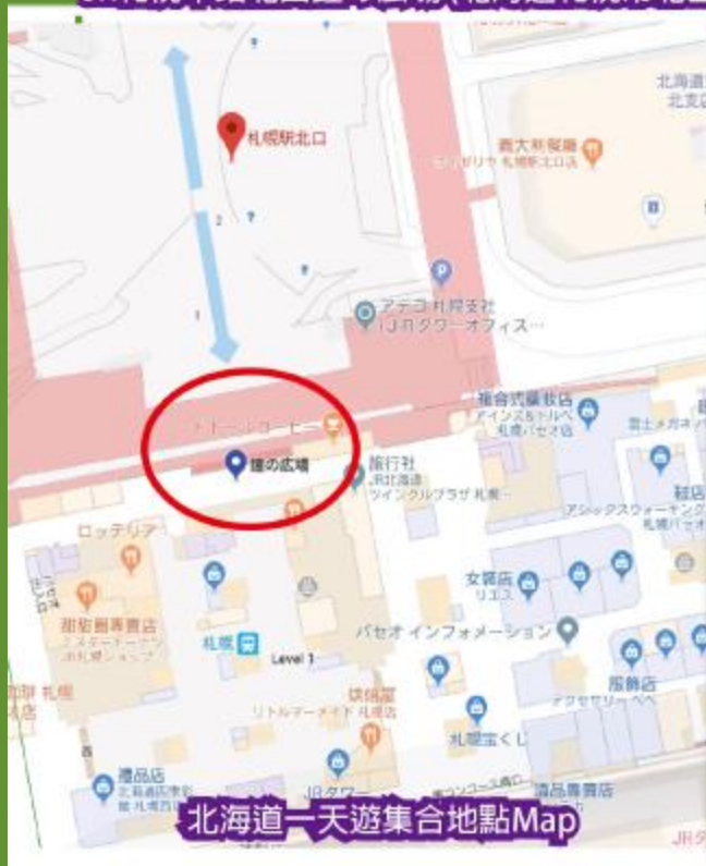
北海道一天遊集合地點Map