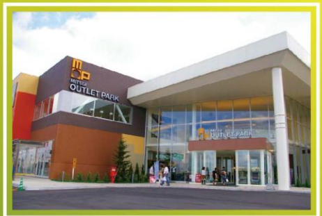
札幌北廣島 Mitsui Outlet Park *