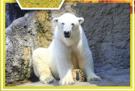
日本超人氣旭山動物園*