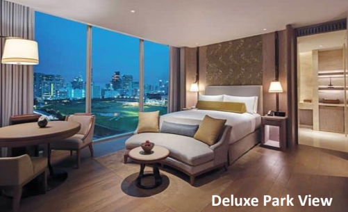
Deluxe Park View