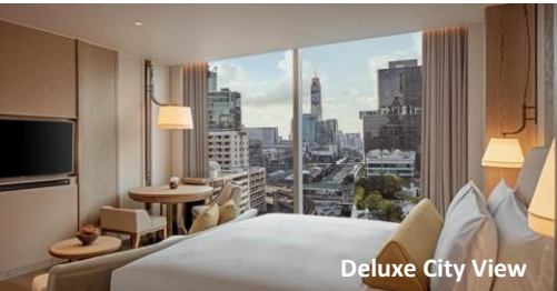
Deluxe City View